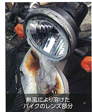
熱風により溶けたバイクのレンズ部分

1件目の火災の状況です。2月9日19時頃、喜沢南2丁目地内で発生し、負傷者1名、全焼6棟を含む住宅、計14棟が焼損しております。