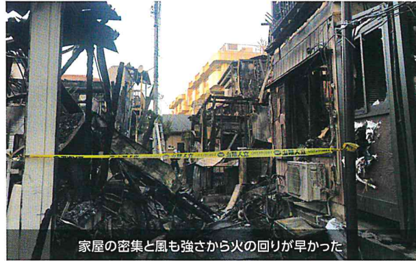
家屋の密集と風も強さから火の回りが早かった

119番通報も判明しているだけで35本と一度期に多数の入電があり、第一通報の内容も住宅から炎が激しく噴出しているとのことで、通報初期の段階で火の回りが早いことが確認でき、被害の拡大