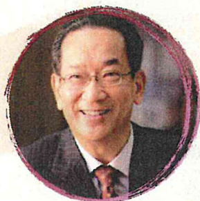
北川 正恭 早稲田大学名誉教授 元三重県知事