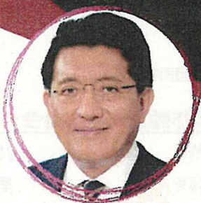
平井 卓也 デジタル改革担当大臣