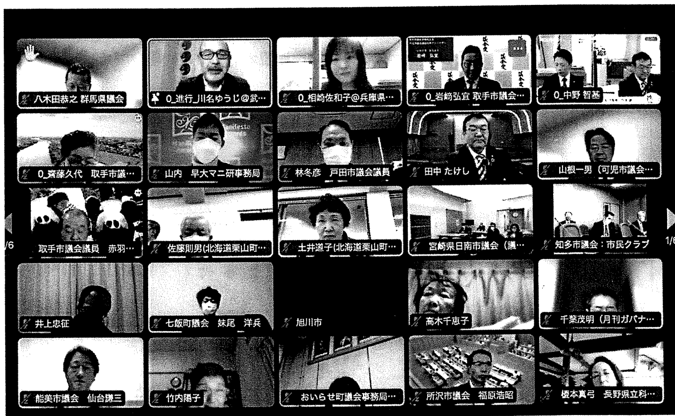
(写真) Zoom参加の様子（参加者のスクリーンショットの一部）

その後、休憩をはさみ、上記市議会の方をパネリストとするパネルディスカッション、そして質疑応答が行われ、閉会となった。