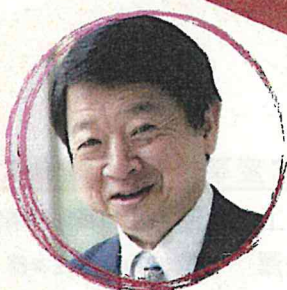
片山 善博 早稲田大学教授 元総務大臣