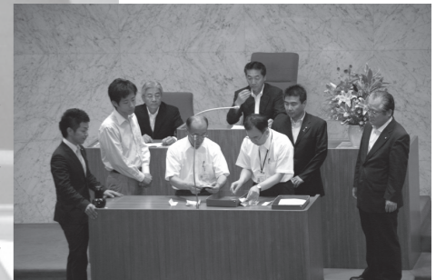
議場の選挙開票風景

議案を専門的に審査するため、担当の常任委員会（総務、文教・建設、健康福祉、市民生活）に付託します。付託を受けた委員会では、担当部課長から詳しい説明を受け、質疑等を行った後、委員会としての結論を出します。 常任委員会と特別委員会（交通対策、議会だより）は傍聴することができます。