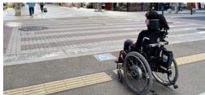
切り欠き配置の例

都市整備部長 道路上の整備にあたっては最新基準や有効な整備事例などを参考に実施している。