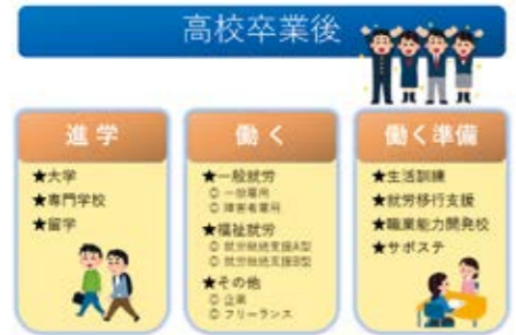
障害のある子の高校卒業後の進路選択について