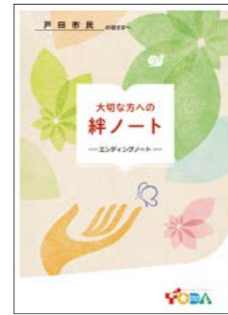
戸田市版エンディングノート「絆ノート」