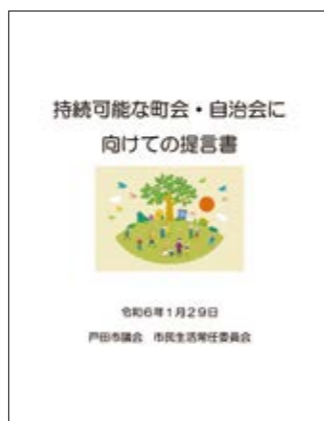
令和6年市民生活常任委員会提言書