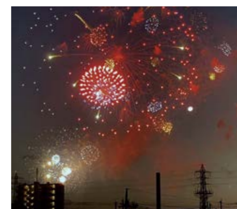
より多くの市民が楽しめる花火大会を(会場外から撮影)

議員 昨年は、無料の自由席が背丈ほどの雑草で利用しにくかった。無料部分の整備も含め、市内先行販売枠の座席数、販売店数を増やし、ネット販売分においても市民優先期間など設けて、市民のために大会を進めて行くことを要望する。