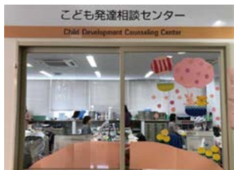
わかりやすいこども発達相談センターの窓口

健康福祉部長 発達に関する相談がどこでも対応できるように、相談体制と連携強化について各部署と協議を進めていく。