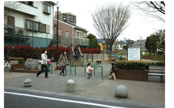
▲セツトバックにより安全性が向上した上前公園

②公園の入口部分が一部で緑石の切り下げがされておらず、バリアフリーでない所が見受けられる。自転車止めが窮屈で、「人止め」になっっているので、改修してほしい。