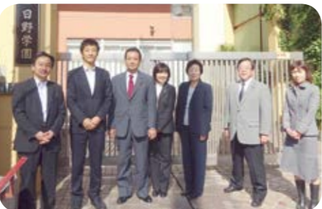
10月27日 品川区立日野学園にて