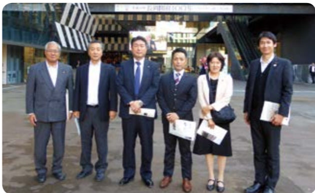
10月26日 アオーレ長岡にて

【検証の結果】 長岡市は、総合窓口など市民サービスの向上を図っている点が参考になり、新潟市は、