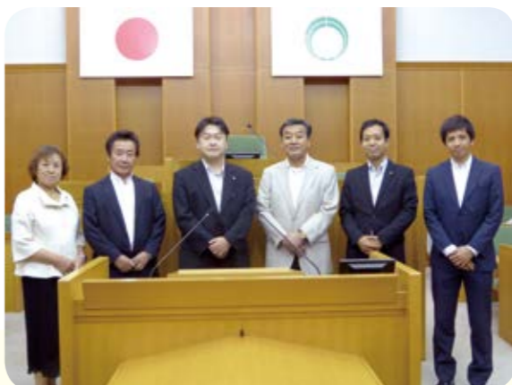
10月12日 松原市役所議場にて

【検証の結果】 松原市の電気料金総額の補助も行っている点を本市でも参考とすべきではないかと感じ、小牧市への視察を通じては、本市でも車上狙