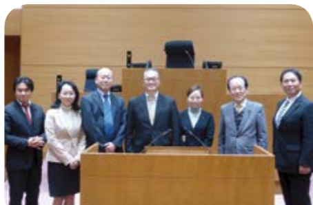
10月19日 町田市役所議場にて