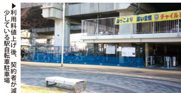
▶ 利用料値上げ後、契約者が減少している駅自転車駐車場

原因は、利用料の値上げで予測より契約者が減ったことが収入減になったと報告されている。値上げが契約者数の減少の原因ならば、契約者数を増やすための利用料の引き下げを行