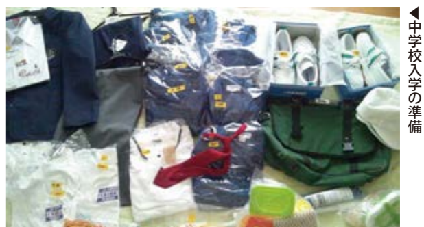
◀ 中学校入学の準備

議員 会場の定員数、対象年齢の引き上げの限界、1千人近い高齢者の移動時の安全性の確保などの課題があり、敬老会を見直したとのことだが、午前と午後に分ければ、従来どおりの敬老会が実施できたのではないか。 福祉部長 高齢者の状況、考え方も多様化している。多くの高齢者が地域でかかわりを深めるような事業につな