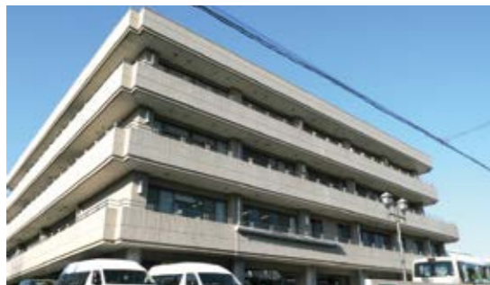
▶ 介護老人保健施設(平成7年開設)

供はあるか。市への働きかけはあるか。再調査の意向はあるか。 市長 面識も資金提供も働きかけもない。再調査は行わない。戸田市では適切な行政執行に努めている。 その他の質問 Q 図書館の長期閉館中に自習席確保を。 A 他部署に働きかけを検討する。