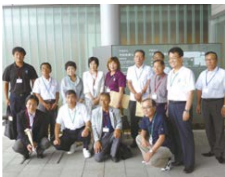
▲市民医療センターにて

議員互助会では、7月28日、姉妹都市である美里町との議員交流会を、戸田市で開催しました。上戸田地域交流センター（あいバル）、市民医療センター、ボートレース戸田の視察と、意見交換を行いました。意見交換会では、両市町の現状や課題について意見交換を行うなど、大変有意義な交流会となりました。