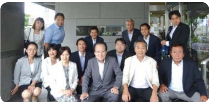
7月4日 箕面市役所にて

両市ともに、運行事業者、地元企業、地域住民など多くの人を巻き込んでコミュニティバスの維持改善に向けた取り組みを行っていたことが印象的でした。