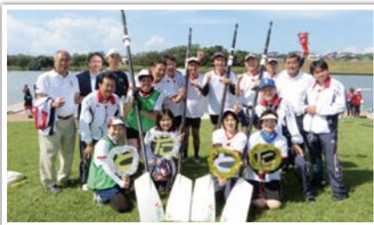
▲銅メダルを獲得し、笑顔の戸田市議会

日頃の練習の成果を発揮し、2クルーとも準決勝進出を果たし、中でも「モクセイ」は決勝戦に進出して、見事3位で銅メダルを獲得しました。