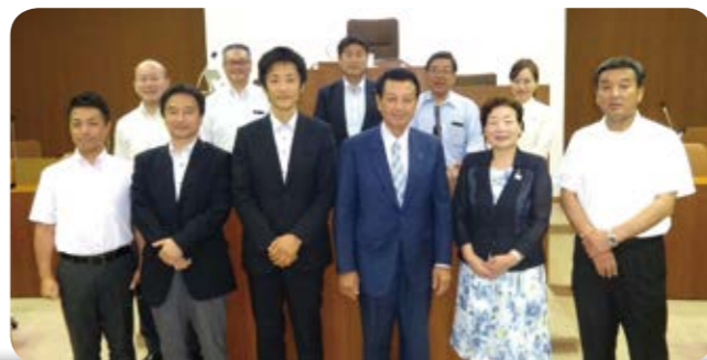
7月3日 嘉麻市議会議場にて

タブレット端末について、導入の効果や年配の議員でも特に自由なく使うことができている点などが確認されました。