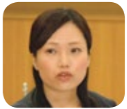
議員 台風で各所が浸水した。早急な対策を。

議員 上下水道部長 雨水幹線や雨水浸透施設等を整備する等、浸水箇所を積極的に取り組む。