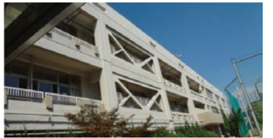
▲戸田東中学校校舎

議員 報告書には鉄筋の腐食は確認されていない。コンクリートの強度も大部分は基準を上回っていた。専門家も、耐震補強工事を行ったので、安全性は問題ないといっている。