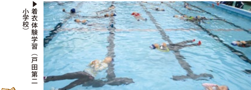
▶着衣水泳学習（戸田第二小学校）