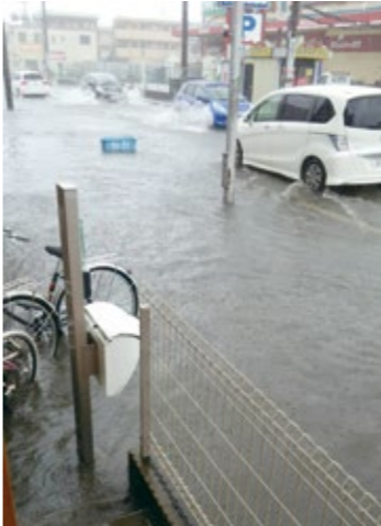
▶戸田市消防本部（新曽） 近くの浸水状況（平成28年8月22日撮影）