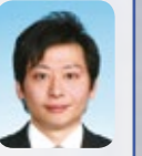
中山 祐介 議員 市制施行50周年お祝い申し上げ

ます。誰も予測できない未来ですが、過去と今の延長線上にあることは間違いありません。過去から学び、未来に希望が持てるよう、力を合わせて今を歩みましょう。