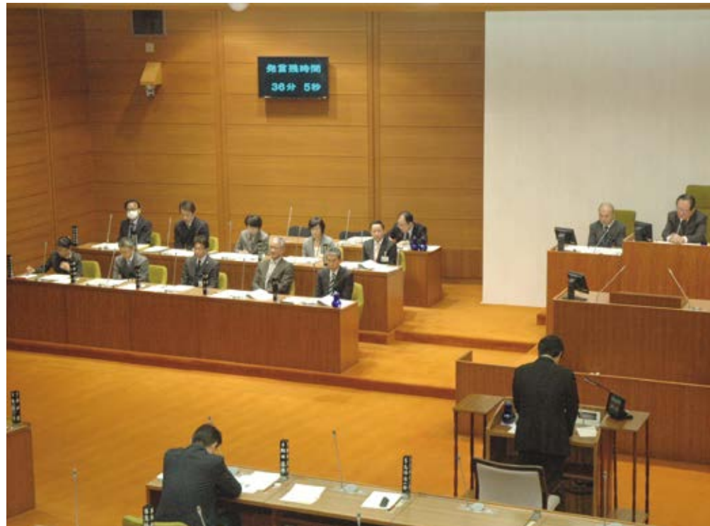
▲執行部と対面した質問席から一問一答。議場の前と後ろに残時間表示があります。