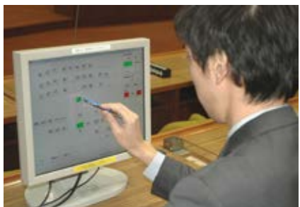
▶パソコンを操作する議会事務局職員

A 質問の残り時間を表示する時計が、議場の前と後ろに一つずつ、それぞれ質問席にも置いてあるんだけど、それを議会事務局の職員がパソコンを使って、発言が始まると時計を進めて、発言が終わると時計を止めて、というふうに操作しているんだ。