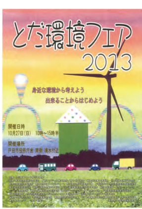
▲とだ環境フェア2023のポスター

議員 環境活動をしていくために、各団体がプロジェクトの核となつて活動してもらえよう、情報交換や支援を行っていく。