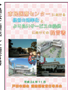
過去に提出した提言書