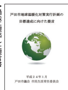
過去に提出した提言書