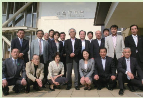
▲美里町の議会だより編集特別委員と一緒に

この視察を受け、紙面の色合いや写真の配置、余白のとり方や各ページのインデックスのつけ方など、今後の議会だよりの紙面づくりに活かしていきます。