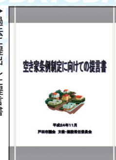
過去に提出した提言書

優秀賞を受賞した「りふ議会だより」では、審議の経過や内容をわかりやすく正確に伝えるため、余裕のある紙面づくりを