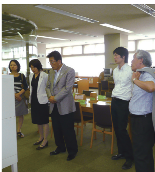
▲市内視察の様子(市立図書館)

A 市の行政の部門別に4つの常任委員会を設置しています。議員は必ず1つの常任委員会に所属します。委員の任期は2年です。