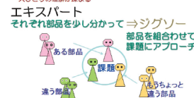
▲シグソー法のしくみの一部