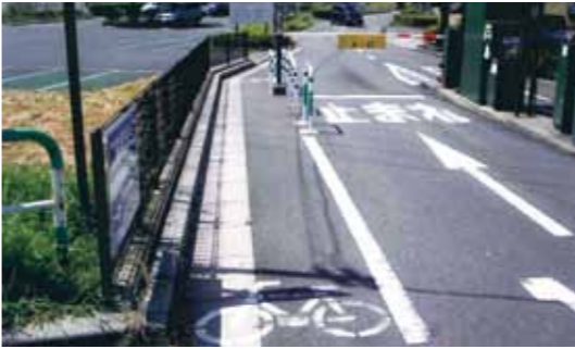
▶この先、自転車はどこを通ったらいいの？(彩湖・道満グリーンパーク)

議員 結婚式事業からの撤退が予定されている戸田市文化会館5階の改修について具体的な計画があるのか。