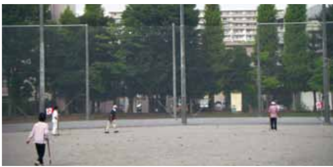
▲中町多目的広場の防球ネット

財務部長 ボール広場の利用時間は、夕焼けチャイムに合わせ施錠しているが、今後は、利用者や近隣の皆様の要望を踏まえて、施錠