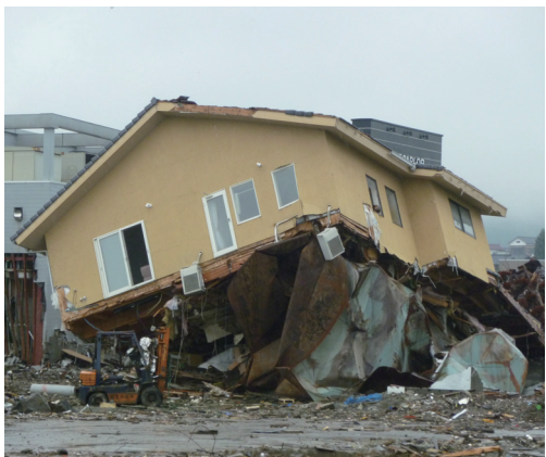
津波で倒壊した住宅(気仙沼市)

相談の推進○診断料の無料化○改修費補助金の大幅アップ○設計費補助○融資制度の創設○耐震シエルトー購入費補助等で耐震化が進むと思いが、いかがか。