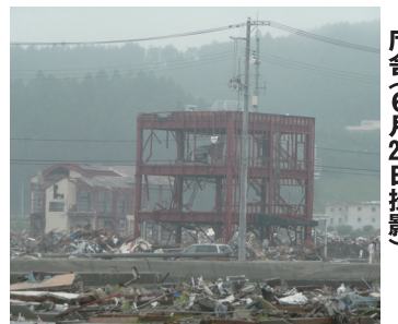
宮城県南三陸町防災対策庁舎(6月26日撮影)

に体験した西宮市職員が、被災者のために支援策を集約し開発・策定した、復旧・復興に優れた「被災者支援システム」の導入を図れ。