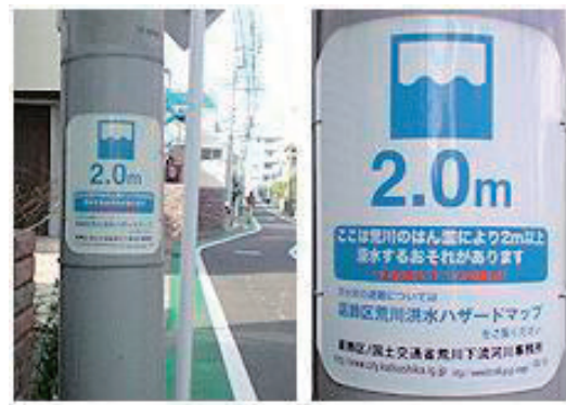
街角に「想定水深」を標示