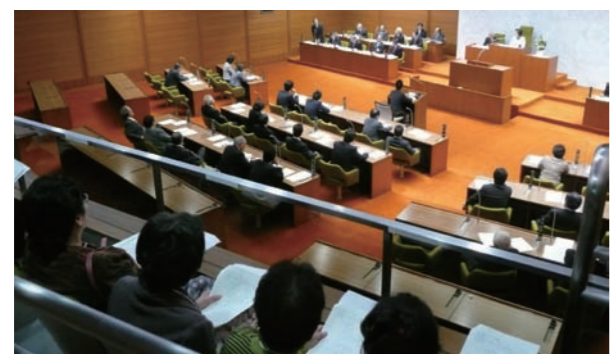
▲傍聴席から見た議場