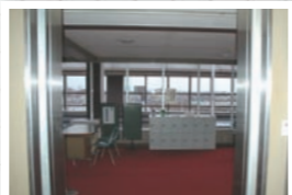
▲8階エレベーター前

市役所2階右側エレベーター8階をプッシュ エレベーターわずか20秒で8階に到着▶▶▶