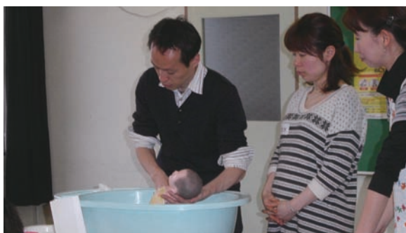
両親学級での沐浴実習

議員 統合後の事務の取り扱い。 財務部長 「証明書発行請求機」を市庁舎3階に設置することで調整を進めている。 議員 市内中学校には立派な武道場があるが、授業における武道の実施状況は。 議員 武道部の部活動の設置状況は。 教育部長 剣道部は5校、柔道部は設置されていない。 議員 柔道部の設置に向けて努力を。