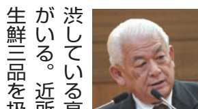
議員 生 鮮品など 日々の買 い物に難 渋している高齢者など がある。近所にあった 生鮮三品を扱う個人商