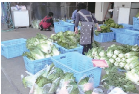
新鮮な白菜を戸田に届けます 美里町にて

議員 美里町との交流として、学校給食米に彩のかがやきを購入してはどうか。 教育部長 単独校（7校）は自校炊飯方式で実施しており、米の購入方法も、美里町と協議しながら、米の流通ルートの確保など、実施に向けて具体的に検