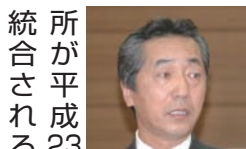
議員 さ いたま地 方法務局 戸田出張

った。国との契約規定からいくと、建物を解体し、更地にして本市に返還するものと思われる。しかし、解体する費用などを考えた場