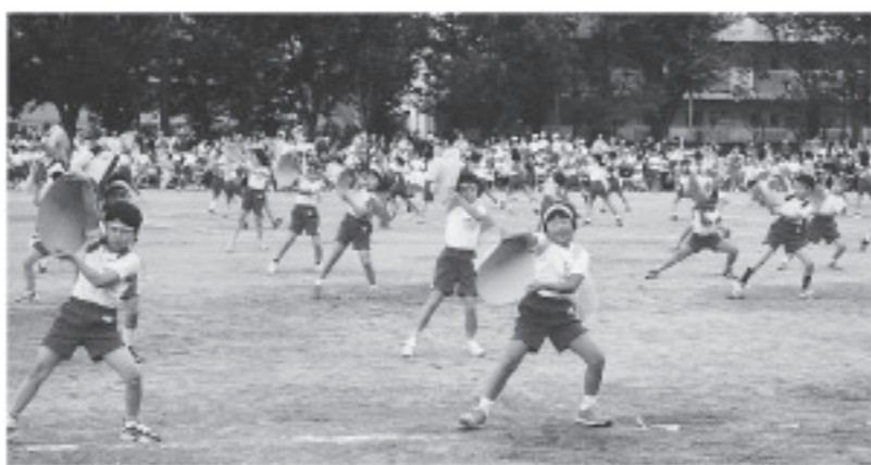
▲よくそろっているね