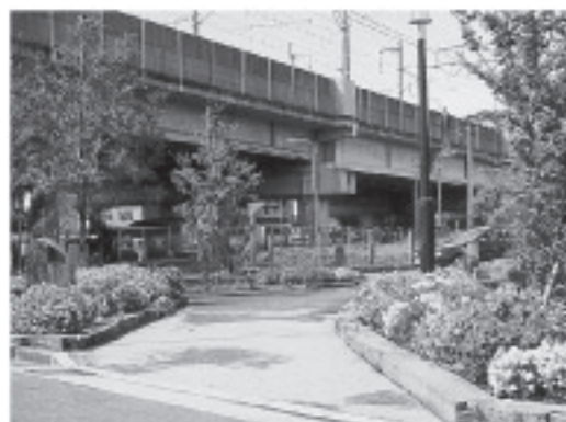
▲戸田市独自のまちづくりを

止め、改めて、今回の4市合併に関する協議には参加しないことを表明します。また、住民投票ですが、誰の目からも明確な結論が示されませんでしたので、住民投票は無くなったものと考えています。 今後は、合併問題を契機に、戸田市の将来を真剣に議論した市民の思いが無駄にならないよう、生かしていきます。 また、合併はしなくても現状のままで良いということではありません。さらなる効率的な行政運営、行政改革を進めてまいります。