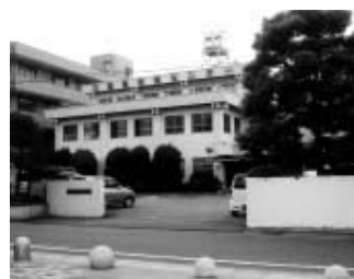
保健センターは市の中心部に

議員 満60歳以上でいる医療保健センターは、テナント方式として民間の医療機関の参入による診療科目の拡大と公的負担軽減として有意義と考えます。診療科目の拡大により利用者が増大し、経営上効果があると考えます。 湧小児科の要望は多いが、24時間体制は難しい。休日 議員 満民間の警備会社や警察OBと市が契約し、防犯のための市内パトロールを実施してはどうか。 議員 満民間の警備会社や警察OBと市が契約し、防犯のための市内パトロールを実施してはどうか。 議員 満民間の警備会社や警察OBと市が契約し、防犯のための市内パトロールを実施してはどうか。