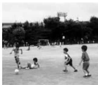
休み時間の校庭は元気な子ども達でいっぱい

拡大を図ってはどうか。湧現在の小児科を24時間体制にできないか。（注）公共事業に民間資金を導入する手法のこと。 議員 満民間の警備会社や警察OBと市が契約し、防犯のための市内パトロールを実施してはどうか。 議員 満民間の警備会社や警察OBと市が契約し、防犯のための市内パトロールを実施してはどうか。 議員 満民間の警備会社や警察OBと市が契約し、防犯のための市内パトロールを実施してはどうか。