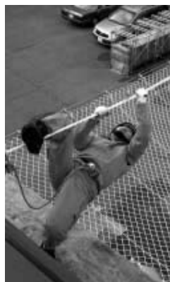
真剣そのものです

議員 消防庁消防審議会の指摘事項を踏まえて、今後の大規模災害に備えての体制強化充実の方針はどうか。 議員 消防庁消防審議会の指摘事項を踏まえて、今後の大規模災害に備えての体制強化充実の方針はどうか。 議員 消防庁消防審議会の指摘事項を踏まえて、今後の大規模災害に備えての体制強化充実の方針はどうか。