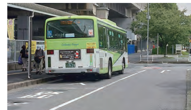
視認しにくい「止まれ」の標識

都市整備部長 現地の状況を確認した。規制標識を管理する蕨警察署へ改善について伝える。