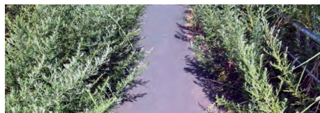
川岸から荒川の土手に上がるスロープ