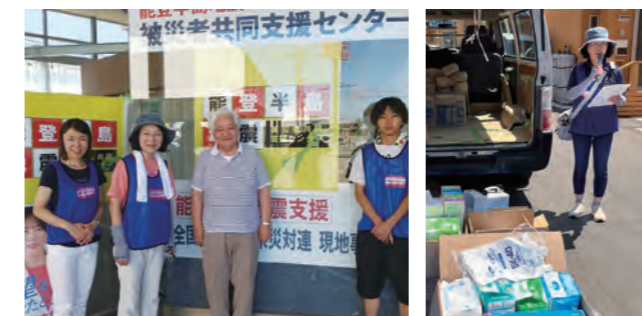
仮設住宅に訪問しマイクで配布を呼びかけた