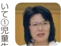
議員 通学路における緊急時の安全確保について

議員 通学路における緊急時の安全確保について①児童生徒への情報と避難方法は②帰宅困難者発生時の子供への対応は。