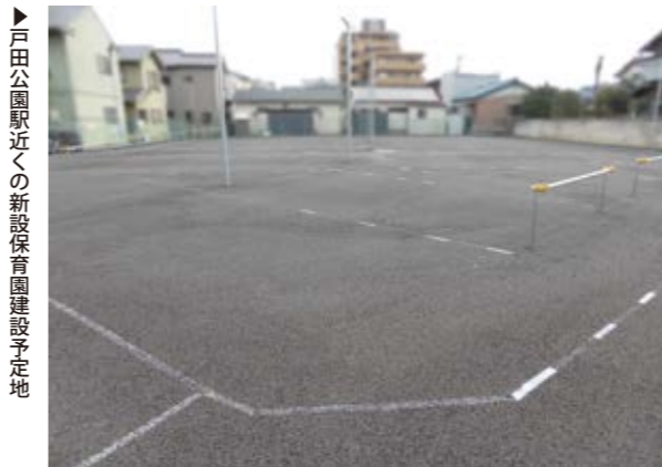
戸田公園駅近くの施設建設予定地

議員 保育園の待機児は昨年の約3倍の106人、認可保育園の保育児童数は375人と急増している。「子育てのまち とだ」の看板に、保育園整備が追いついていない。年度内の緊急対策の具体化、一時保育の時間延長、来年度の見込みに合った保育園整備と保育士の確保を急ぐべき。