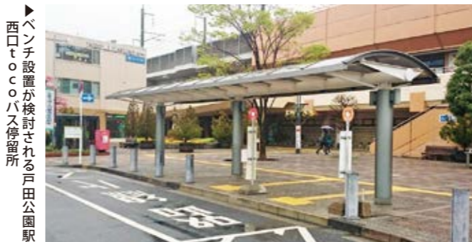
ベンチ設置が検討される戸田公園駅西口tocoバス停留所