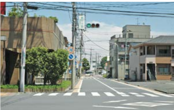
左側建物の武蔵野銀行北側に通学路があります。

議員 北大通り笹目2丁目交差点・ファミリーマートの裏の横断歩道に、手押し信号もしく