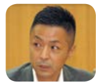
議員 戸田公園駅西口のtocoバス停留所

ベンチの設置を求め、ベンチを設置すべきと考えるが市の考えは。市民生活部長 他の停留所と比べ待合者数も多いことから、利用客の利便性向上に向けベンチの設置を検討する。