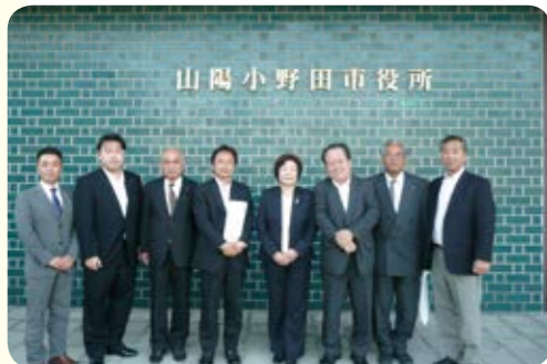
山陽小野田市役所