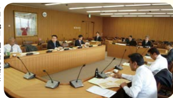
▶11月13日 刈谷市役所にて

岐阜県美濃市立美濃中学校では、「少年非行防止タウンミーティング」を開催し、SNS等によるいじめ対策の取り組みを実施していました。参加者は、生徒や学校関係者のほか、警察や地域住民の代表者である「少年警察ボランティア」であり、連携を密にして取り組んでいました。愛知県刈谷市では、市立雁が音中学校にお