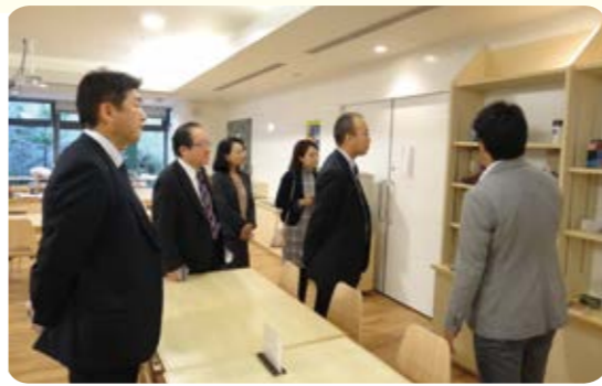
▶11月13日 堺市・森のキッチンにて

大田区では、庁舎内を案内、誘導するためのサイン表示の改修に取り組んでいました。設計段階で区民団体と意見交換を行い、改修後も、障害者に協力してもらい、一緒に検証作業を行うことで、庁舎内の誘導効果の向上に努めていました。堺市では、庁舎内の食堂を、社会福祉法人が「森のキッチン」として運営していました。スタッフの半分が障害