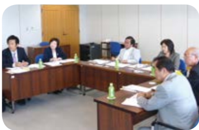
▶10月14日 大田区役所にて

大田区では、「放課後こども教室」と学童保育を一体的に行う、「放課後ひろば」事業に取り組んでいました。子育て支援課と教育委員会事務局の職員が連携して事業を推進しており、専有教室や体育館などの学校施設を有効に活用した事業が行われていました。