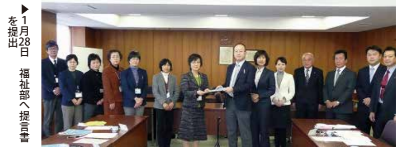
1月28日 福祉部へ提言書を提出

運動器の障害のため移動機能の低下を来した状態を「ロコモティブシンドローム」といいます。予防として、筋力の維持、特に下肢の筋肉の減少を防止するため、軽い運動ではなく、少し負荷をかけた運動で筋力の維持を図る必要があります。第2次戸田市健康増進計