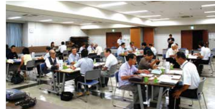
▶第4次総合振興計画後期基本計画協働会議

その他の質問 いたずらが続く公園への防犯カメラ設置を検討しては。A 関係部署と十分調整し検討する。