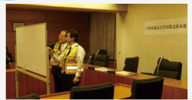
▲戸田市議会災害対策支援本部設置訓練の様子

戸田市議会における災害発生時の対応要領及び議員行動マニュアルに沿って、戸田市議会災害対策支援本部設置訓練を実施しました。訓練では本部長(議長)と副本部長(副議長)が、議員の安否確認を行い、同時に訓練した市の災害対策本部の設置を確認した後、戸田市議会災害対策支援本部の設置を宣言し、市の災害対策本部に報告を行いました。