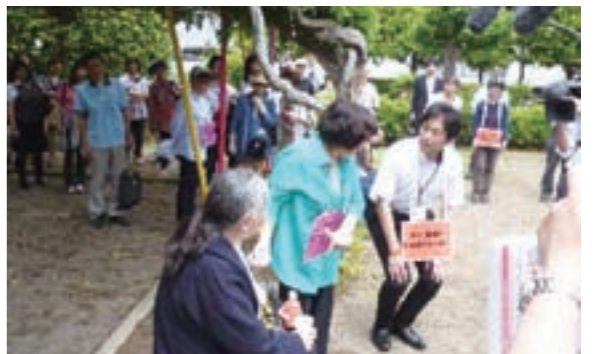
命のひと声訓練 認知症徘徊模範訓練