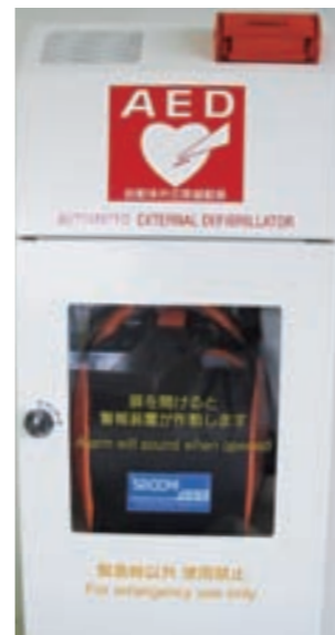
AED…心停止状態の心臓に電気ショックを与え、心臓の働きを正常に戻すための医療機器

議員 公共施設に於ける夜間及び閉庁日にもAEDが使える環境への検討状況及びコンビ