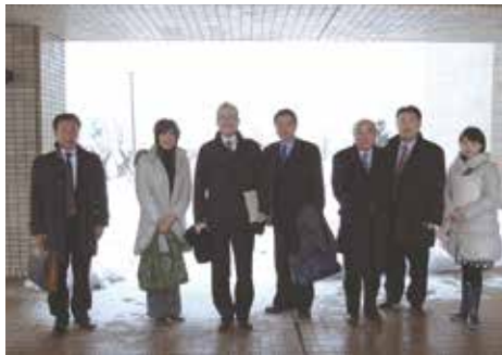
◀1月17日 見附市役所にて

見附市では、空き店舗を活用し、健康運動教室を実施しています。専用の歩数計(5千円)を購入してもらい、教室に備えつけられたパソコンと連動させることで、運動メニューの作成や運動の成果を記録しています。将来的には、医療費の適正化も期待できます。 【意見・感想】 本市でも、空き店舗や公共施設の一部を活用して、実施できる取