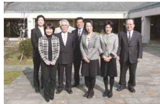
◀1月28日 伊万里市民図書館にて

るまで、市民と一緒に図書館づくりを進めました。主な事業として、移動図書館を巡回させ、ボランティアとともに、保育園などでおはなし会を行っています。 【意見・感想】 小郡市が取り組んでいる学校図書館との連携は、指定管理者による運営では難しいのではないかと感じま