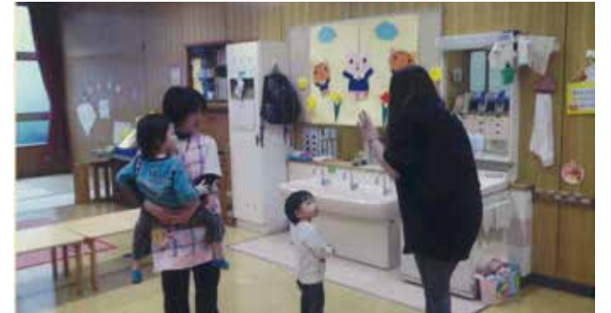
▶たまにはお子さんを預けてリフレッシュを(笹目川保育園)

議員 子供の話 を頼める ご近所さ んや親戚 がない専門主婦は、 自分の自由な時間が持 てずに育児ストレスを 抱えがちである。公的 な子供預かりサービス の充実に向け、「一時 保育」の土曜日実施、 「二時預かり」の午前 実施と土曜日実施をし てはどうか。