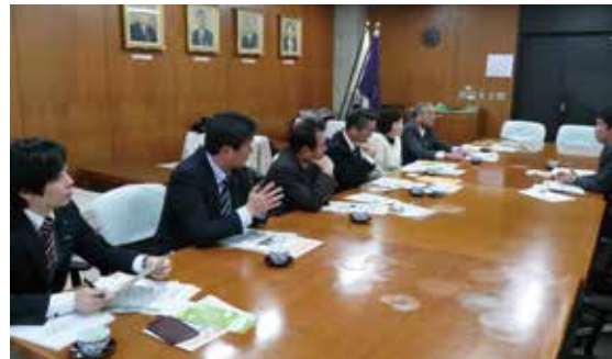
◀1月15日 世田谷区役所にて

世田谷区では、世田谷サービス公社が、太陽光パネルメーカー等と提携し、大量発注を前提に低価格化された太陽光発電システムを販売する「世田谷ヤネルギー」に取り組んで いて、世田谷区も、積極的に宣伝を行うなど一体となって取り組みを進めていました。 【意見・感想】 既築の戸建て住宅に普及する際の課題等を認識しました。