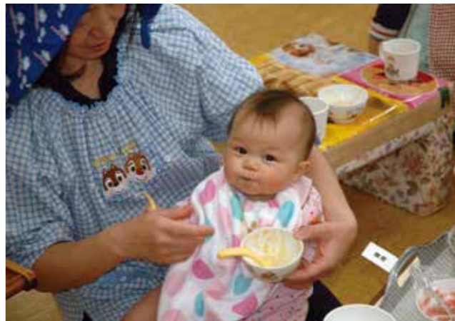
▲出生率アップに向けた取り組み

子育て支援と高齢者の健康増進を推進する。 議員 放課後学習の充実、学童保育と連携を。また、授業についていけない児童への支援を。 市長 「とだっ子学習クラブ」の充実により学習支援を行っていく。