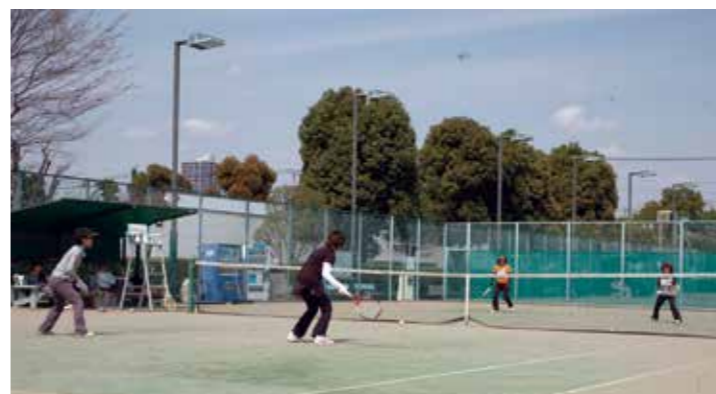
▲スポーツセンターの使用料も値上げされました

議員 公共施設の再整備が単年度に集中し過ぎ、前年度比64・3%、32億円の増、これらに伴い建設事業の借金が総額52億2千万円と、財政運営のバランスを欠いているのでは。 市長 公共施設等整備基金や地方債の適正な活用で財政負担の平準化を図り、他の市民サービスとの両立を図りながら実施している。