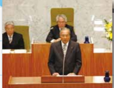
▲所信表明会（平成23年2月）