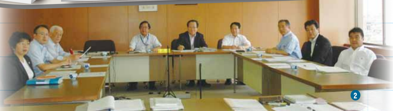
▶現在の議会改革特別委員会メンバー