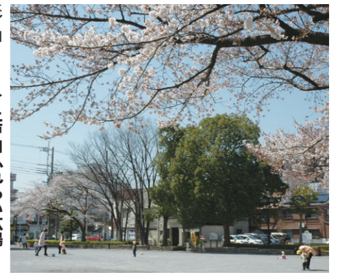
市からの情報をテレビで見られないか 市からふれあい広場

議員 施設の計画を行う際、市の所有する土地の用途地域、高度地区規制、土地の価値など、その土地の持つポテンシャルを考慮するとともに、都市計画法、建築基準法などの法律、市の考える都市計画のビジョン、計画施設周辺の状況を考慮し計画されているか。①工業