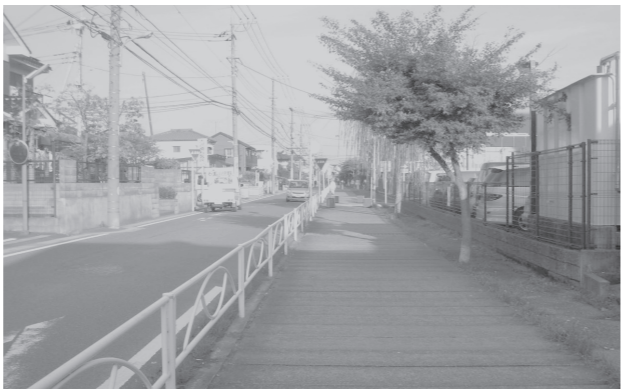
▲新曽中央地区のシンボルロードと して整備される予定の地下水路

地区まちづくり協議会 が提言した整備計画案 と市の案の相違点につ いて。 説明会での意見・要 望の検討は。今後のス ケジュールと見直し、