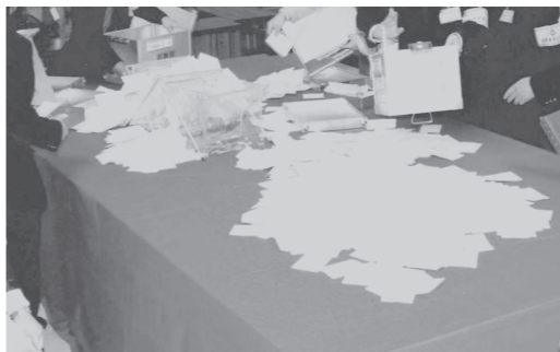
▶効率的な開票作業に努めています

て、人や物、経費の推 移がどうであったか。 今後、有権者数の増加 が予測される中、どの ような体制を考えてい くのか。 行政委員会事務局長 開票事務従事者数 は、国政選挙では1 00名、その他は85 名程度。今回99名で 担当。効率化のため 十分な事前打ち合わ せと経験豊かな職員