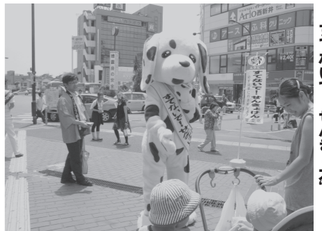
▲足立区の選挙啓発キャラクター、 ”すてな”で、せんきよ犬。

長 市民が正しく理解 し、接種の判断を行う ための周知責任を適切 に果たしたい。任意の 予防接種であるため、 自己責任で接種を受け ることを広報していく。 議員 学校で説明やパ ンフ配布の広報を行っ ていくとのことなので、 市が接種を勧めている かのように誤解を受け ないよう、特に配慮い ただきたい。