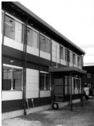
12月1日開所の起業支援センター

(9月8日先議) しました。 また、新規の起業支援センター条例の制定や、平成15年度の一般会計補正予算及び5つの特別会計の補正予算等を原案のとおり可決しました。 なお、WTO農業交渉等に関する陳情については、採択されました。 今議会で提案された主な議案 ・起業支援センター条例 ・新規に事業を起し、又は事業を起して間もない方への支援を行い、地域産業の発展に資するとともに、新たな雇用の場の創出を図るための起業支援センター設置条例の制定です。 ・一般会計補正予算 ・歳入で主な内容は次のとおりです。 ・滝起業支援センター使用料の新規計上 ・滝地域保健推進特別事業費補助金の新規計上 ・滝土地売り払い収入の増 ・歳出で主な内容は次のとおりです。 ・滝コンビニ収納システム構築等備上料