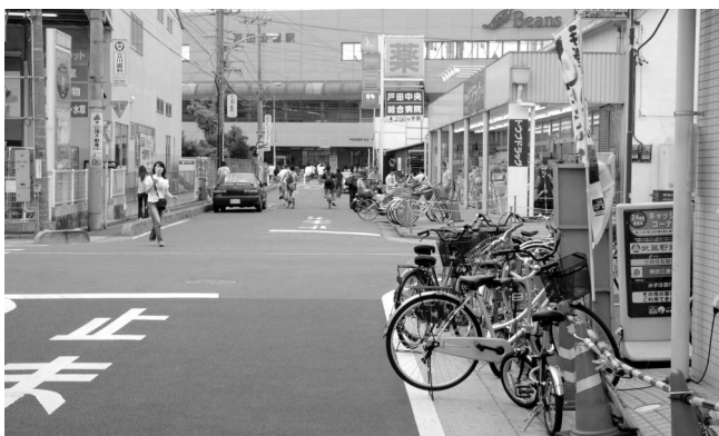
▲ 戸田公園駅へ向かう道路に多くの放置自転車が

通行用のスロープを整備してありますので、それを利用していただきたいと思います。 議員 そのスロープを利用すると南側公園内に出ます。そこから北側公園内に行く専用スロープがありません。今後、利用者が安全に通行できるように整備できませんか。