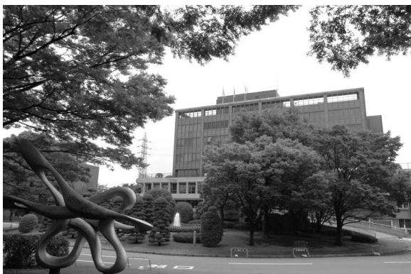
▲ 公平で透明な行政を推進するために

議員 国民が裁判員として刑事裁判に参加し、プロの裁判官とともに有罪無罪や量刑の決定をする裁判員法が成立し、4年以内に実施