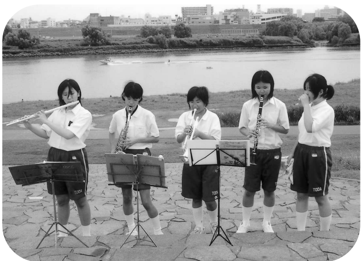
▲ 休日の荒川堤防、地元の中学生が管楽器を楽しく練習中