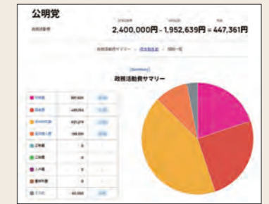
政務活動費の使途がグラフで確認できます