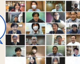
この年はオンラインで開催しました