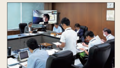
9月定例会の委員会では、委員長がオンラインで出席して進行了