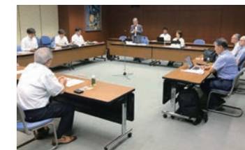
政策提言機能のさらなる向上を目指して

一関市議会は、「政策提言等の実施に関する指針」を策定しており、提言する政策の実行性確保に向けた執行部との協議や、提言書の提出を議会で議決することなどを規定しています。