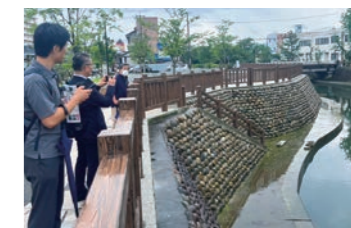
大垣市内の川沿いを調査しました

一宮市では、社会実験を行った結果、市内の歩行者数が増加しました。実験と並行して各種組織が立ち上がり、人のつながりも生まれ、既存商店街の新規出店も増加傾向にあります。