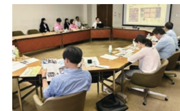
積極的に情報発信をしている和歌山市議会

王寺町議会では、議会だよりのコンセプトを「あなたと議会をつなぐガイドブック」とし、読みやすいレイアウト、キャッチーな表紙、議会を身近に感じてもらおう企画などの紙面構成がされていました。