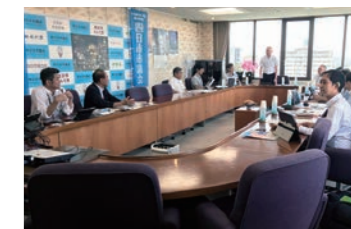
通年議会により緊急課題への素早い対応が可能に

四日市市議会は、市議会で全国初の通年議会を導入した議会であり、通年議会のメリットは議長の権限により速やかに本会議を開催できることや、災害時などの緊急性や必要性の高い行政課題に素早く対応できるとのことでした。