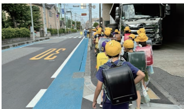
不具合の対応が後手になり、安全を脅かす重大な事態を引き起こした。

議員 不具合は市全体にとって重大な事態である。GPS を利用したより最適なサービスを要望する。