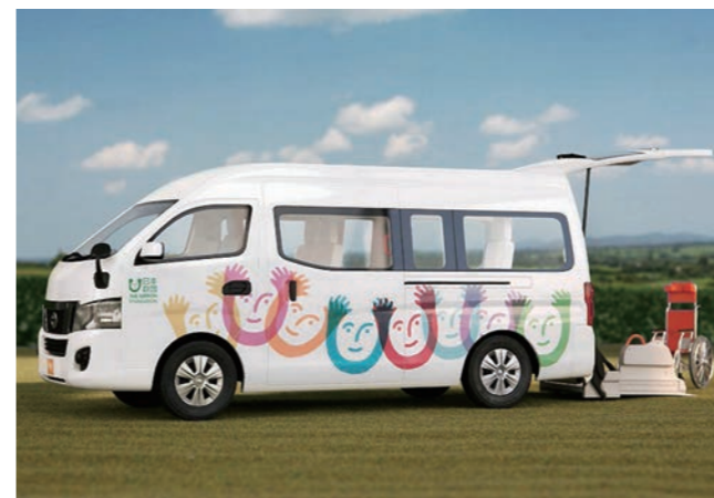
移動支援事業サービス

健康福祉部長 ①個々の事情を勘案しながら包括的なサービスの提案に努め、他自治体の運用について調査研究する。②移動支援事業サービス提供団体のヘルパーの人員やサービス提供開始時間などを確認、実態把握に努める③「グループ支援型」の導入については利用者やヘルパーの安全の確保や利用条件など、実施自治体の運用状況などを調査研究の上、検討する。