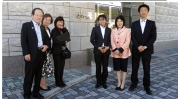
▲ 10月30日 白田の湯にて