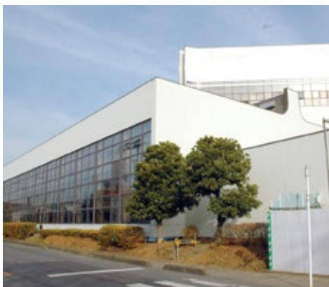
▲閉鎖中の屋内プール棟

議員 朝夕の通勤通学時、非常に危険である市役所通りセブン・イレブン前交差点に信号機の設置を。 市民生活部長 設置条件が合わず難しいが、警察と協議を続ける。