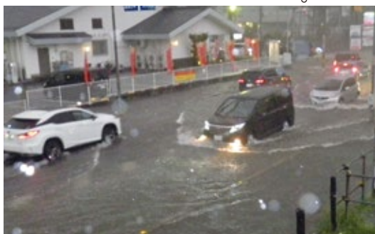
▲冠水した戸田市消防本部付近(9月18日)

環境経済部長 市民の要望に応じて薬品を散布する等の方法で実施。 議員 浸水後の消毒対応への基準を設けることを要望する。