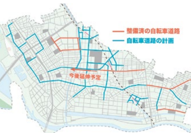
▲自転車道路網の整備

議員 具体的にどのような制度か 教育部長 対象は19歳未満を第1子として第3子以降の市立小学生。補助額は給食費の半額で一人当たり年間約2万円。試算では推定約千人が対象で、約2千万円の予算が必要。制度周知は、学校からの保護者向け通知文、ホームページ、市広報への掲載などを考えている。