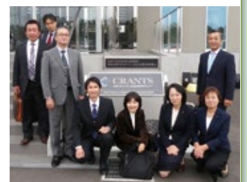
11月8日 次世代モビリティ社会実装研究センターにて▲

路線バスなど、地域限定の自動運転システムを目指しており、戸田市でも活用できる可能性を感じました。