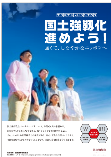
▶国土強靱化啓発ポスター

環境経済部長 市内全域の企業・事業所を対象とした基礎調査を実施予定。その結果を基に支援策を検討・実施していく。