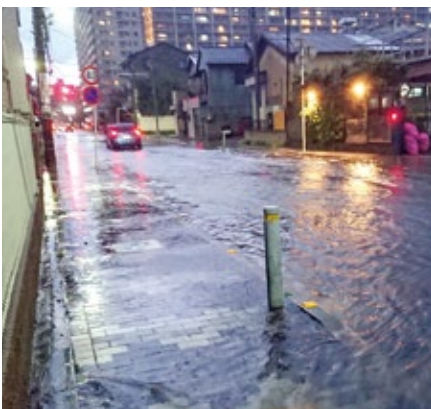
▲ゲリラ豪雨により冠水した中町2丁目付近(9月18日)