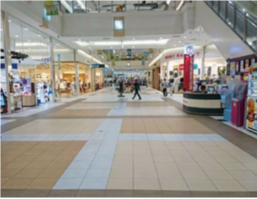
▲店舗1階のさくらそう広場 (イオンモール北戸田)

A 設置場所は、店舗1階のさくらそう広場を使用することと調整。設置期間は、選挙期日の直前の木曜日、金曜日及び土曜日の3日間、開設時間は、午前10時から午後7時までを予定。なお、さくらそう広場は、事前予約が必要なことから、選挙の都度、店側と協議しながら設置場所の調整を行っていく。