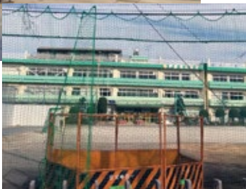
▲12月現在の戸田東小学校・戸田東中学校建て替え工事現場