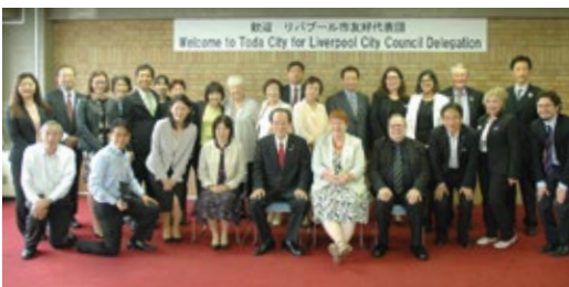
▶10月4日 友好代表団との記念撮影

この懇談会には戸田市議会正副議長をはじめ、11名の議員が参加し、リバプール市長をはじめとしたリバプール市友好代表団の方々との市政などについて意見交換を行い、親睦を深めました。