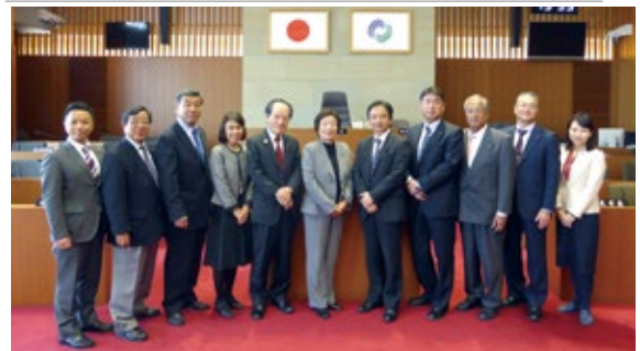
11月1日 諫早市議会議場にて

諫早市の議会に関する資料を積極的に情報提供する取り組みは、導入を検討したい取り組みであり、大村市の議員提案に対する検討結果報告は、その後の対応をきちんと確認する取り組みとなっており、大変参考となりました。