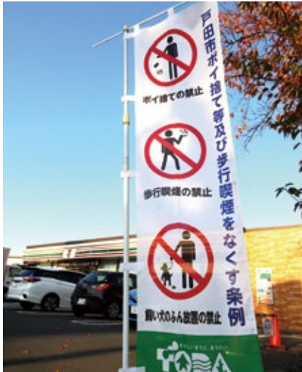
市内に設置されている啓発用ののぼり旗