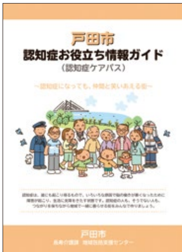
▶戸田市認知症お役立ち情報ガイド

お役立ち情報ガイド」をはじめ、医療機関等が作成しているチェックリストを活用することで、およびその状態を把握することができ。しばらくは「認知症お役立ち情報ガイド」の認知症チェックの活用と地域包括支援センターへ相談していただくなど、早期発見・早期対応につなげていく。 診断に必要な検査費用助成については、先進市の取り組み状況を見ながら、効果的な早期対応策を研究する。