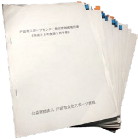
▲スポーツセンター指定管理者報告書

議員 加えて、そのスポーツクラブに指導を受けている子の親御さんたちから複数の告発があった。