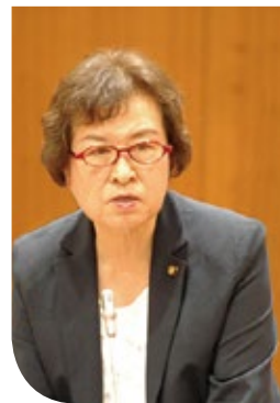
つちや えみこ 土屋 英美子 議員