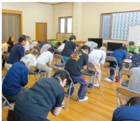
▲「健康づくり」と「地域づくり」、「高齢者の交流」 一石三鳥のTODA元気体操 (平成28年7月 馬場町会)

福祉部長 TODA元気体操を通して高齢者の健康づくりや地域交流を図っている。あらゆる分野で先進事例を参考に各部署・機関と連携し、高齢になっても地域で健康に生きがいを持って安心安全に暮らせるまちを目指す。