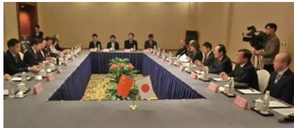
▲表敬訪問・実務会談

てはどうかと開封市長から提案があり、戸田市長、戸田市議会議長から、「歓迎いたします。」と回答しました。