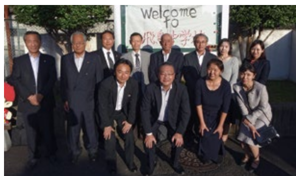
10月25日 飛鳥中学校にて▶

奈良市は、小中連携を意識し、小中合同の学校運営協議会を運営していること、北名古屋市は、専任のコーディネーター2人が地域と学校をつなぐ役割を果たしていたことが参考になりました。