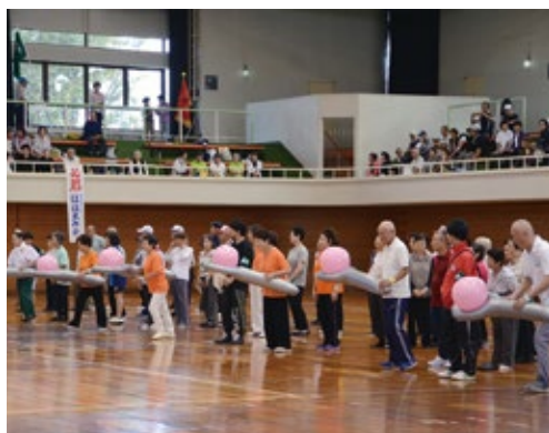
▲今年もにぎわいを見せたシルバースポーツ大会 (10月6日)

市民生活部長 大規模改修では平成31年度に基本計画の策定を予定。エレベーターの設置や要望事項等