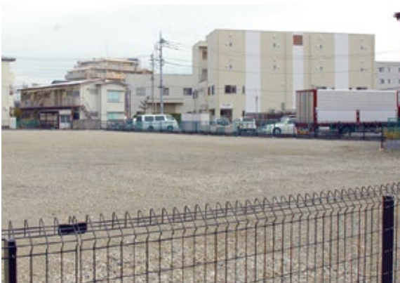
▲戸田第一小学校 校庭代替予定地

A 学校から代替地までの子供の移動時間は、約10分と想定。安全に移動できるように、警備員を増やしたり、代替地の南側道路に横断歩道を設置すること等を考えている。