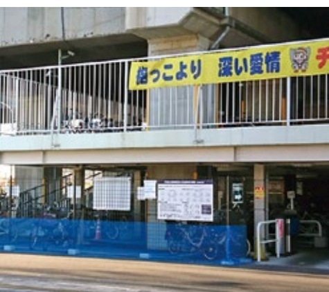
▲まだまだ駐輪スペースがある駅自転車駐車場

市民生活部長 ①②運行事業者と調整、協議していく③現行のサービスと料金を維持する。