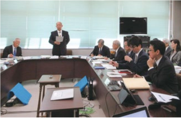
▲視察も多く、活発な意見が交わされる教育委員会定例会