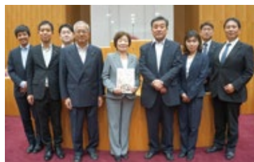
10月19日 寄居町議会議場にて▶

議会だよりにQRコードを活用することや読者を呼び込むための特集・企画等を今後検討してまいります。