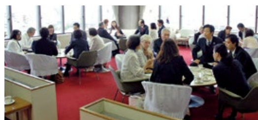
▲友好代表団と意見交換

友好交流事業を所管する市民生活委員会では、10月4日から7日にかけて行われた海外姉妹都市オーストラリア・リバプール市友好代表団の来訪に合わせ、懇談会を開催しました。