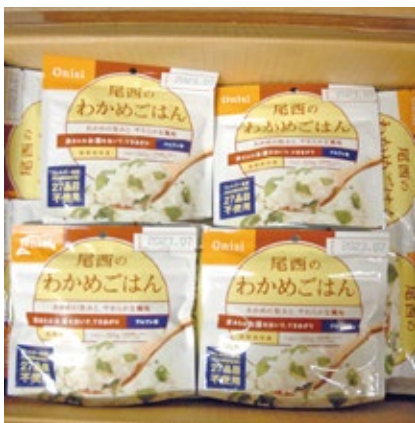
▲備蓄されている食物アレルギー対応食品

都市整備部長 不動産・建築・法律の専門家団体と協定を締結し、相談体制を構築する。