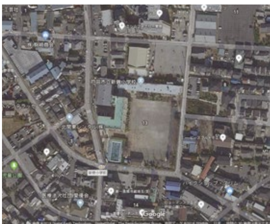
▲自校式給食調理場の建築予定地(校舎北側の校庭)

とは、市長の決裁あったとのこと。なぜ、12月議会に提案されなかったのか。委員会軽視と思えるが、