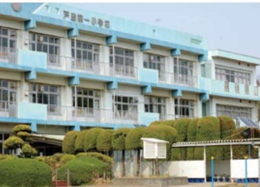
▲平成33年度に建て替え予定の戸田第一小学校

①コミュニティ・スクールを含めた地域と一体となった教育の推進や地域住民の健康増進・体力づくり・コミュニケーションなどを図るため、地域住民などの意見を取り入れ、地域開放に対応可能な拠点として整備すること。 ②地域住民ならびに防災担当などの意見を取り入れ、地域の防災拠点として十分機能するよう整備すること。