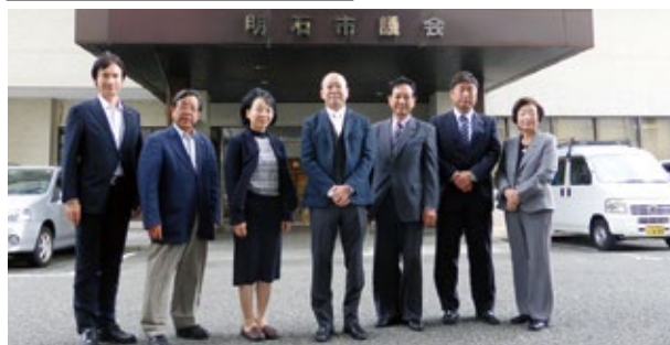
10月26日 明石市議会にて▶

明石市の養育費、親権の取り決めを支援する取り組みは、子供の幸せに関わる大事な取り組みであると感じました。