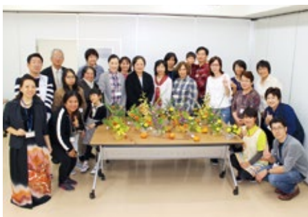
▼多文化交流ひろば「華道を楽しもう」