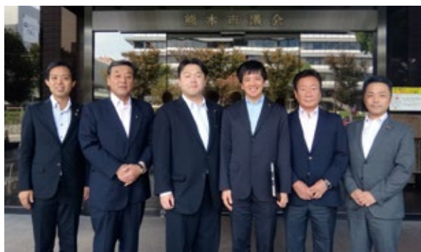
▲ 10月16日 熊本市役所にて

粕屋町は、手続きのワンストップ化が来庁者の負担軽減に有効であると感じ、熊本市は、ICTを活用し、業務の効率化を進めている点が参考になりました。