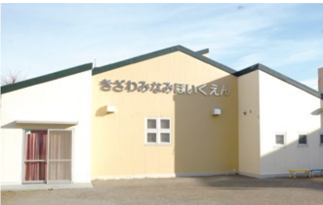
▲改築される喜沢南保育園

工期は、本契約締結日の翌日から平成33年1月29日まで。スケジュールは、平成32年3月10日までに新園舎の引き渡しを完了し、平成33年1月29日までに旧園舎等の解体工事、外構工事を完了する予定です。