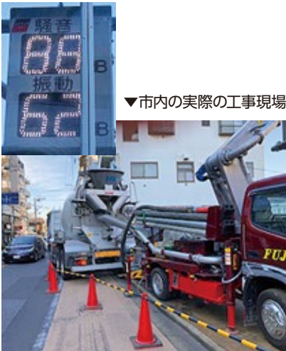
▼市内の実際の工事現場

都市整備部長 調整委員会は昨年度2件。金銭補償等案件は、調整の対象としていないが、騒音振動等については工事着工後も申し出が可能である。