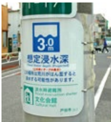
▶浸水深・避難場所標識