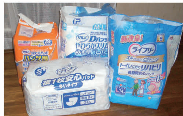
▲支給されている紙おむつ。20種類の中から最大5パックと制限されています。

議員 紙おむつの支給限度数が5パックから10パックに引き上げられる。紙おむつは介護施設や高齢者の生活に不可欠なものである。紙おむつは介護施設や高齢者の生活に不可欠なものである。紙おむつは介護施設や高齢者の生活に不可欠なものである。