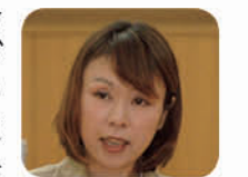
議員 幼稚園に補助金が少ないの声を上げる。戸田市独自の補助金の引き上げを。また、国の幼稚園就園奨励費補助金は、年収360万円以上の階層において兄弟姉妹の年齢要件(小学4年生以上は数えない)があり、多子であったりも給付されない。その世帯にも