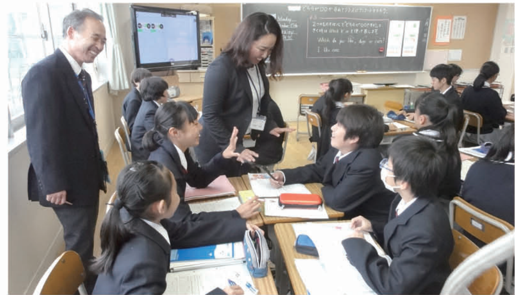
▲未来へはばたく「とだっ子」たちの授業風景 ※議案とは関係ありません。

6月定例会は5月29日から6月20日までの23日間の会期で開かれ、提出された22件の議案等を、いずれも承認・可決・同意しました。また、4議案に対し延べ9人の議員が質疑し、議案1