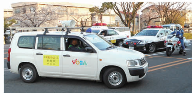
▲公用車の青パト（青色回転灯装備車両）

市民生活部長 警部 警察官OB 市全職員、警備員による市内巡回パトロールを、県警とは別に昼間と深夜帯に行っ