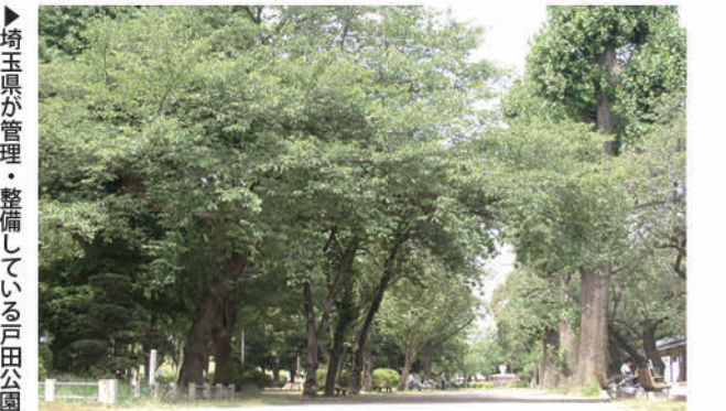
埼玉県が管理・整備している戸田公園

やってもらいたいとの声が多数であった。寄せられた声を生かすべく、市民の要望を県に伝え、公園整備を進めるべきと考えるが。 環境経済部長 アンケート調査で、現状の維持管理に対し意見を多く頂いている。県に、整備や、より良い管理をお願いしていきたい。