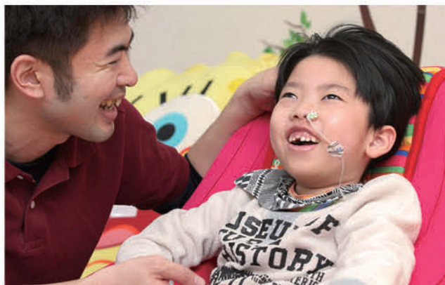
▲医療的ケア児