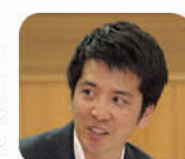
議員 バ ス情報フ ォーマッ トが定め られた。