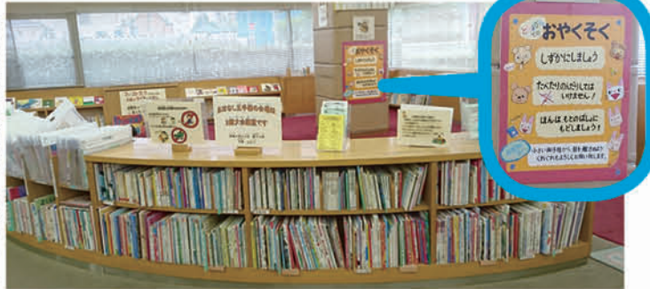
▶戸田市立図書館の「お話しコーナー」に張られた注意書き

議員 子どもの連れの市民が過ぎやすい図書館、正面玄関ホールのソファを撤去し、喫茶スペースに、中学生のテスト期間中の講座の開放を検討すべき。