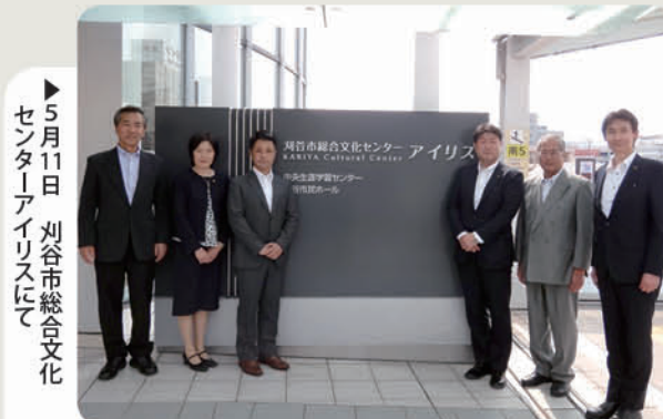
▶5月11日 刈谷市総合文化センターアイリスにて

刈谷市は、市民ホールや生涯学習センターが入る総合文化センターアイリスを整備する際、利用団体の意向を確認するだけでなく、ユニバーサルデザインを導入するため、障害者団体など、約30団体から意見聴取を行い、その意見を施設設計に反映していました。神戸市は、宿泊施設