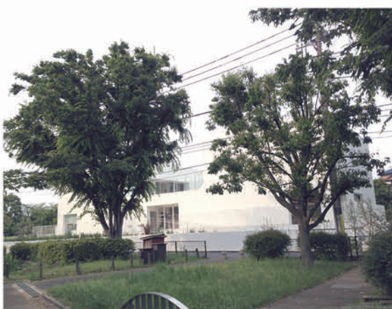
▲都立祖師谷公園内の「茶々そしがやこえん保育園」

議員 都市公園法などの改正に伴い全国の公園内に保育所などの福祉施設を設置できるようになるが、本市の可能性はどうか。一方で、公園機能の減退にはならないか。