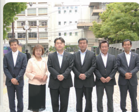
▶5月12日 枚方市役所にて