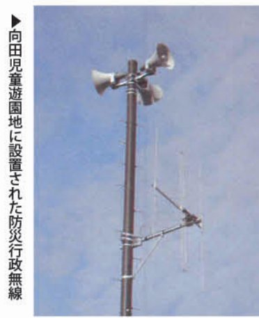
向田児童遊園地に設置された防災行政無線

危険管理監 ①放送塔の整備を行っている。受信機は電波状況により影響があるためフリーダイヤルやスマートフォン