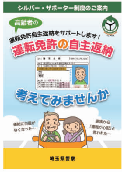
▲シルバー・サポーター制度のご案内