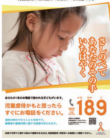
▲平成28年度「児童虐待防止推進月間」リーフレット

議員 子育て相談ルームは、虐待防止のために、児童相談所と連携をとれる体制も整えている。特に出産や子育てに不安を感じる初妊婦に対し実施していることはあるか伺う。