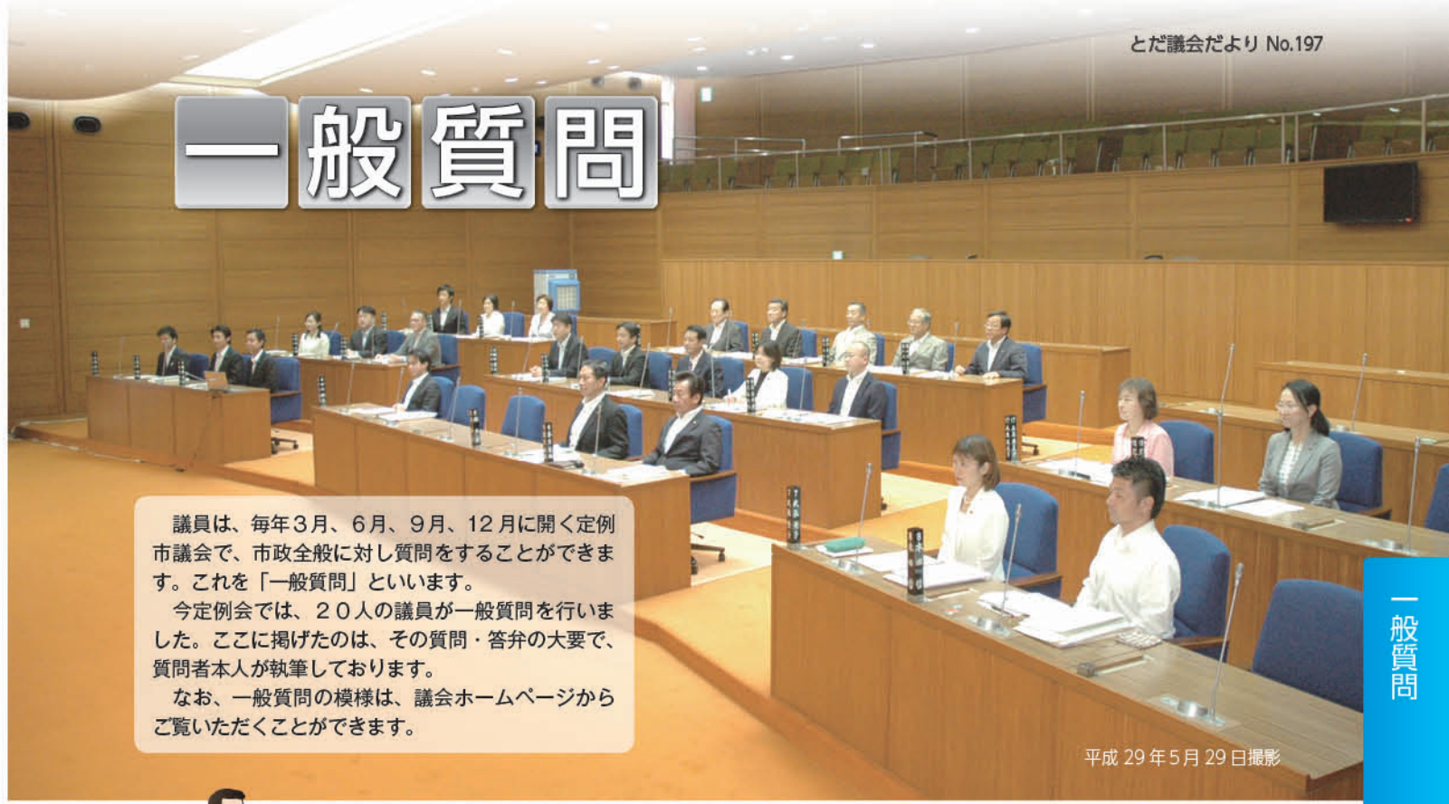
平成 29 年 5 月 29 日撮影

議員は、毎年3月、6月、9月、12月に開く定例市議会と、市政全般に対し質問をすることができます。これを「一般質問」といいます。 今定例会では、20人の議員が一般質問を行いました。ここに掲げたのは、その質問・答弁の概要で、質問者本人が執筆しております。 なお、一般質問の様子は、議会ホームページからご覧いただくことができます。