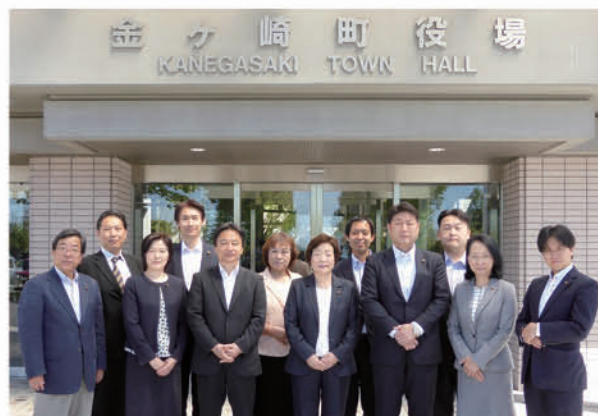
▶5月19日 金ケ崎町役場にて

「やはば議会だより」 は、手に取ってもら うために表紙、また、本 文まで読んでもらうた めに見出しに力を入れ