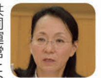
議員 来年度から国民健康保険事業が県との共同運営となり、県の試算では戸田市の1人当たりの保険税額は、183%となる。モデルケース3人家族(夫婦・子ども1人)、所得額200万円世帯の年間保険税額24万5400円は、新たに44万6000円となり、到底払える額ではない。一般会計からの繰り入れを継続すべき。

議員 子どもの連れの市民が過ぎやすい図書館、正面玄関ホールのソファを撤去し、喫茶スペースに、中学生のテスト期間中の講座の開放を検討すべき。