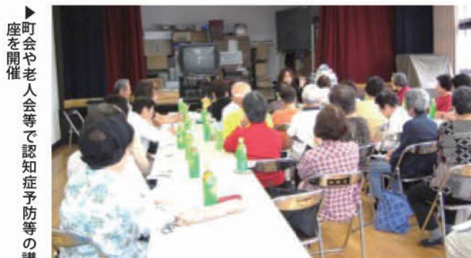
町会や老人会等で認知症予防等の講座を開催