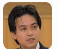
議員 戸田市の運転免許の自主返納の状況は。

議員 戸田市の運転免許の自主返納の状況は。トクシー、バス回数券等、市の独自の特典を返納後の代替交通手段も考えては。