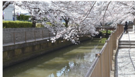
▶さくら川・聖橋～早瀬橋間の遊歩道（整備済み）

寿命を考慮し景観を維持管理する計画を④天王橋・修行目橋間に遊歩道の延伸を⑤投棄ごみや川底の泥、上流からの汚水で色や臭気が問題。景観対策に加え水質改善を要望する。 都市整備部長 ①安全対策を検討②有用性は高いが遊歩道は河川改修の後③桜の植え替え計画は大切と認識。定期的な剪定や河川巡視で対処する④木の伐採