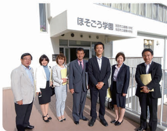
▶5月8日 池田市・ほそごう学園にて

池田市のほそごう学園では、昇降口の分散配置や選択性のある動線の確保、正門とグラウンドを見渡すことができる小中合同の職員室など、施設一体型小中一貫校ならではの工夫がされていました。また、将来、教室を使い回すことを想定し、容易に高さの調節が可能な黒板を設置するなど、小学生・中学生どちらでも使用できる教室となっていました。