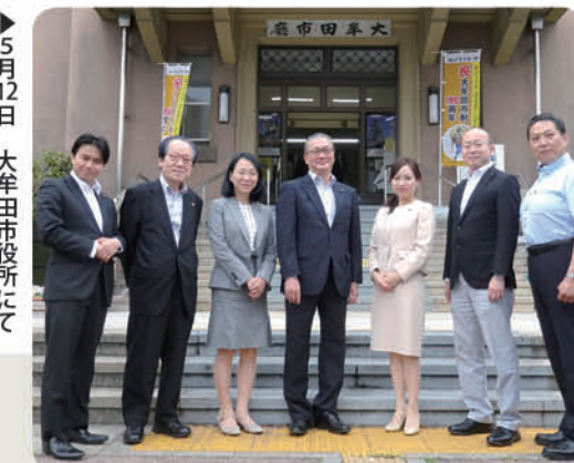
▶5月12日 大牟田市役所にて

山鹿市、大牟田市では、多様な人材、専門的な人材の育成、認知症の人の地域支援ネットワークの形成、子ども頃から認知症教育など、幅広い世代に対する認知症施策の実