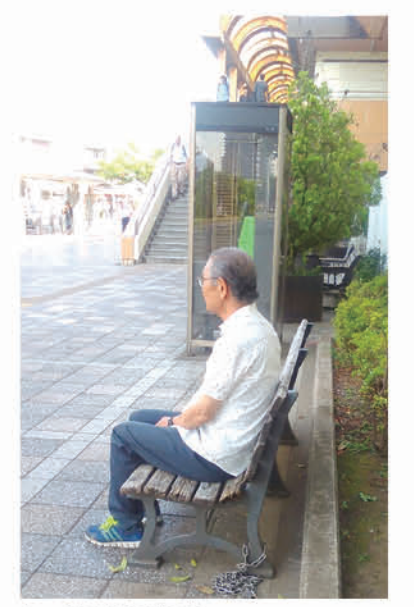
▲一息つけるベンチ

議員 高齢者等、継続した歩行が困難な方から駅改札前にベンチを設置してほしいとの要望があるが、可能か。