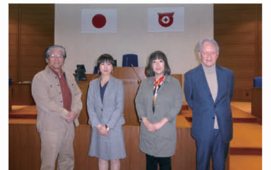
現在の議会モニター

A. 15人だよ。市内にある団体に推薦をしてもらっている市もあるけれども、戸田市では公募だけでやっているんだよ。