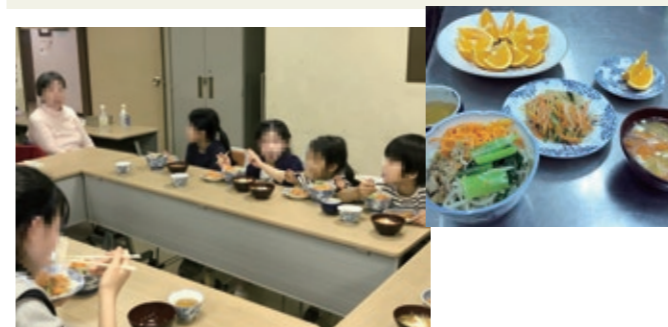
子どもや高齢者が集まる食堂の様子

意見 ①子ども食堂や学習支援の周知は、こどもの居場所ネットワークにおけるSNSだけでなく、チラシやポスターなどでの周知を柔軟に行って欲しい。またネットワーク団体から出された課題は、直接的な支援を②図書館の学習スペースは福祉センターの建替えなどで、スペースの確保を③制服のリユース事業は、本市が行うことも検討して欲しい。