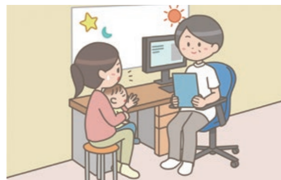
時代とニーズに即した健診体制を

A 本市の乳幼児健診は、多職種が関わり発育・発達を総合的に確認できることから、すべて集団方式で実施している。迅速な支援や信頼関係の構築につながる点が利点である。一方、保護者の日程調整の負担や専門職の確保が課題である。コロナ禍では一部個別方式を実施し継続性は確保できたが、受診率低下や受入れ体制の構築などの課題もある。選択制導入は慎重に考える必要があるが、一部健診の個別化については他自治体の状況を踏まえ調査・研究していく。