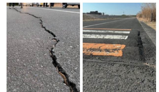
会場の整備は大会成功への必須事項

A 戸田市らしい大会となるよう詳細な内容やスケジュールなどについては、今後、県と調整する。