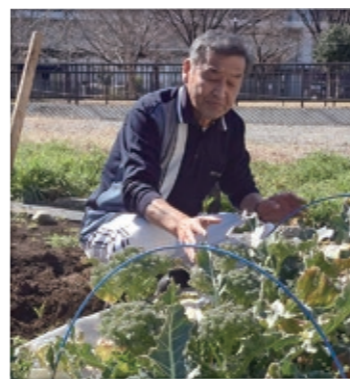
作物の生育状況の確認をしている場面