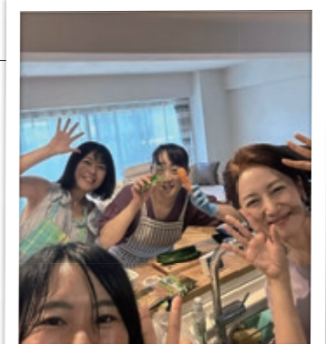
女子会では食いしん坊シェフ担当!!