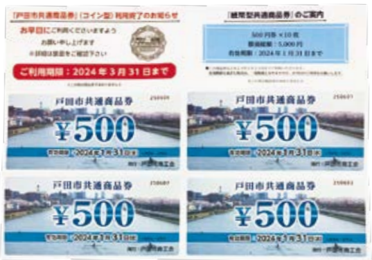
敬老祝ひ品は紙の商品券、プレミアム付商品券も紙で