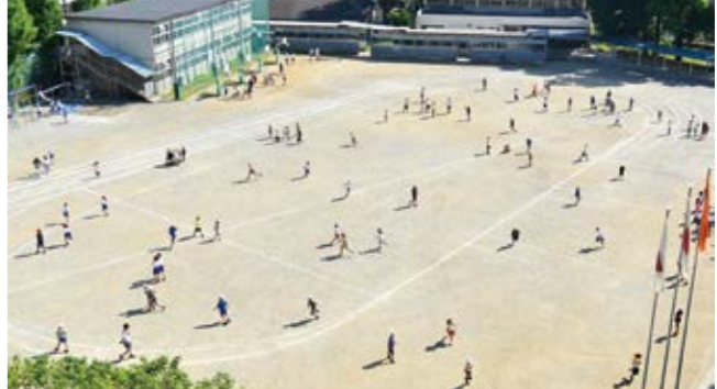
混雑する休み時間の運動場

教育部長 体力面等、発達上の問題となるような事例はない。国の指針では、小学校の校舎は、地上 3 階建てまでが望ましいとされており高層化は行わない。土地購入は、近隣の地権者から買い取り要望がないため行う考えはない。運用面を工夫して取り組んでいる。