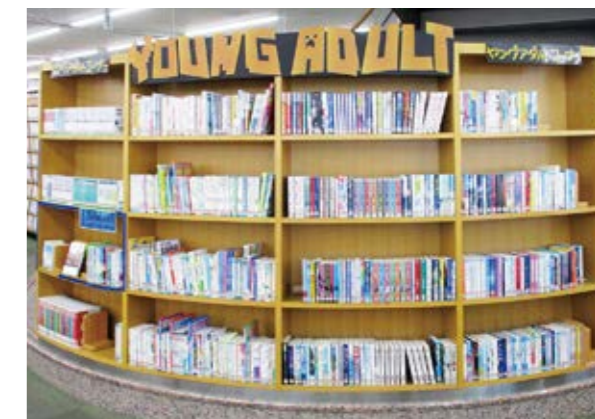
ヤングアダルトコーナー(戸田市立図書館 HP から)

委員 当委員会が提言した内容に向かって取り組んでいただけており、今後は非常に楽しみにしている。