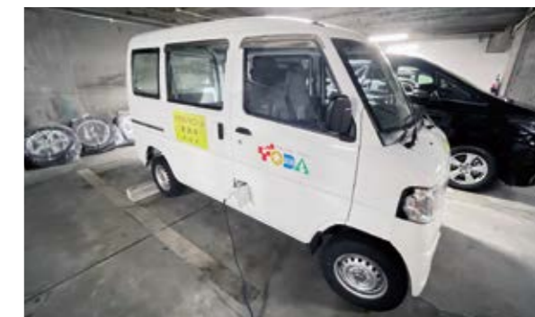
電気自動車の導入が進められている

執行部 入力した情報が学習に使われて、意図しないところで回答されるリスクなどがあることから、個人情報や機密情報を入力しないといったルール付けをしていきたい。また、インターネット上の漏えいリスクが考えられるため、クローズドネットワークで利用できる環境を構築していきたい。