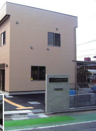
▲福祉作業所かがやき

会計の予算総額は626 億563万7000円 で、対前年度比2・8％ の減となっています。 〔水道事業会計〕 水道事業会計の予算は 次のとおりです。 Category Item Amount (¥) 収入 (Revenue) 収益的収入 25億1 682万4000円 収益的支出 23億2 584万3000円