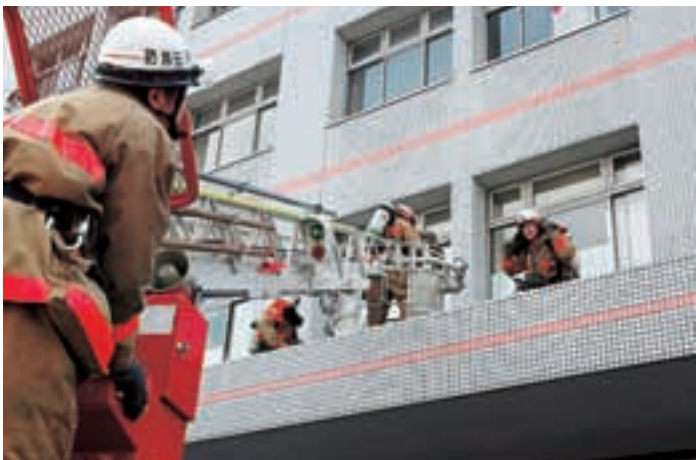
▲ 訓練でも気迫がみなぎっています

本市初となる設計・施工一括発注方式による総合評価一般競争入札を採用し、業者が決定したが、技術評価点と入札金額における評価の考え方について質疑を交わし、県の総合評価のガイドラインに準じて、加算点を30点とする形で、審査委員会で決定したが、試行的な部分もあるため、今後、状況を見ながら総合的に検討したいとの答弁がありました。