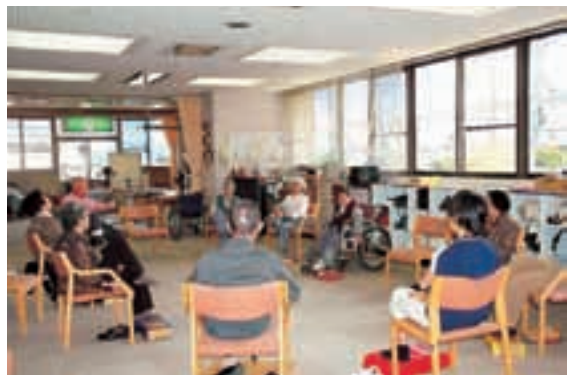
▲ 足がしっかりと上がるようになりました（通所リハビリ）

衛生費の成人保健事業費では、新たに構築される保健情報システムについて質疑を交わしました。