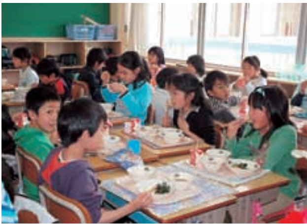
▲ みんなで食べるとおいしいね

土木費の公園費では、樹木の植栽方法を初め、目隠しとなっている植え込みの改良、幼児に対応した遊具の設置について意見を交わしました。 教育費・施設建設整備費の学校給食施設整備事業では、委員より、これまでの単独校調理場建設事業の経費はかなりの額に上っており、当局は調理場のコスト削減を行うと言っているが、限度とあるので、この際、根本的な見直しを検討しても