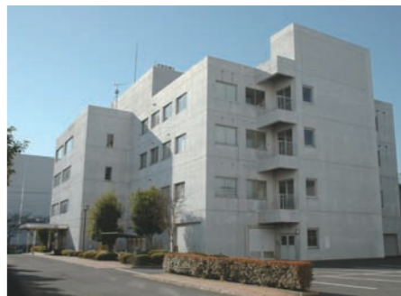
さいたま地方方法務局戸田出張所