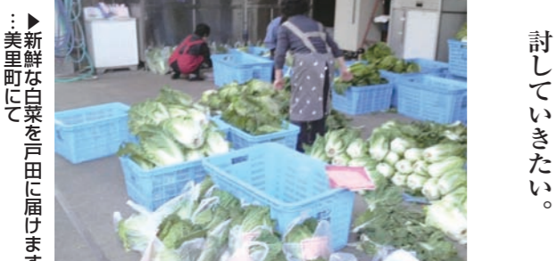
新鮮な白菜を戸田に届けます。美里町にて

議員 ① 法務局戸田出張所が統合され、証明書発行に必要な印紙売りさばき所を庁舎内に設置し、利便性を検討してはどうか。②土地建物の返還に関して、建設時の経緯と契約書の内容はどうか。