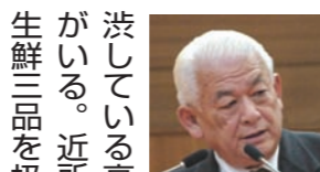
議員 生鮮食品など日々の買い物に難渋している高齢者などがある。近所にあった生鮮三品を扱う個人商