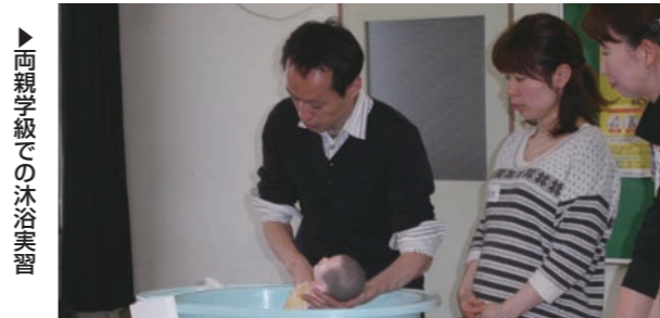
両親学級での沐浴実習

議員 本市は若い世代が多く、核家族化された社会で不安や孤立感の中で育児に悩み、相談する相手もないまま、虐待や、うつ病と不幸な結果となることが多くなっている。市内の小中学校においても、いじめ・不登校は埼玉県では減少傾向にあるが、本市ではさほど減っていない。