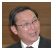
議員 ① 法務局戸田出張所が統合され、証明書発行に必要な印紙売りさばき所を庁舎内に設置し、利便性を検討してはどうか。②土地建物の返還に関して、建設時の経緯と契約書の内容はどうか。